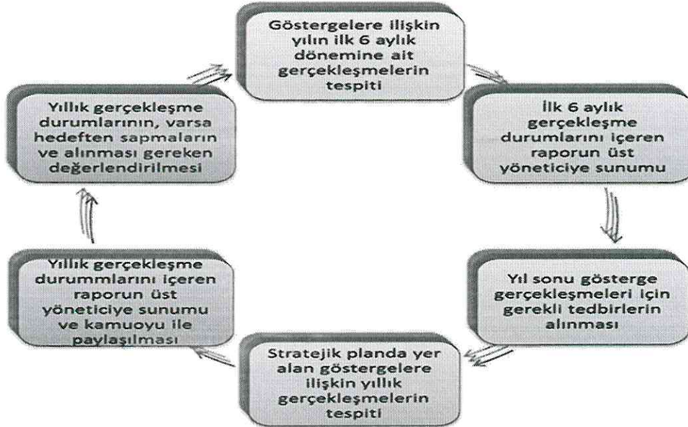
Şekil : 3 Hediye Alay Aktaş Anaokulu 2024-2028 Stratejik Planı İzleme ve Değerlendirme Modeli